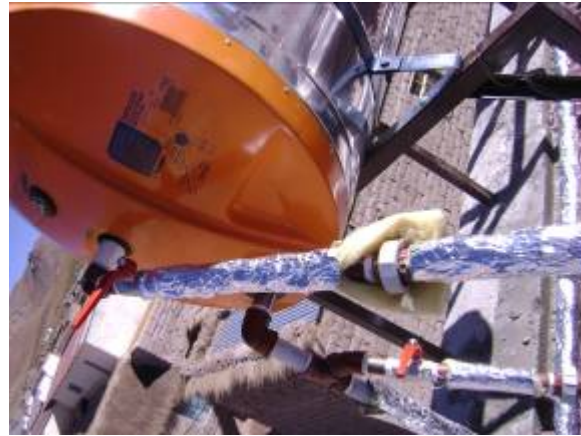
Foto 12. Soldadura de uniones de los colectores y el recubrimiento de las cañerías con material anticongelante.

A medio día se logró concluir la instalación del sistema termo-solar en el albergue turístico comunitario.