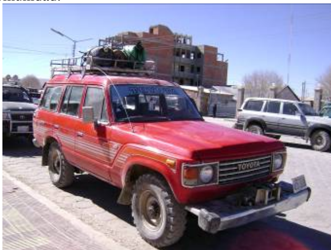
Foto 2. Camioneta 4 x 4, contratada para el viaje a la comunidad.

La empresa SIE destinó uno de sus camiones livianos para el traslado del equipo termo-solar desde la ciudad de Cochabamba hasta el lugar de instalación ubicado en la comunidad de San Antonio de López. El camión partió la mañana del 8 de julio del año 2008 de la ciudad de Cochabamba. Se acordó con el personal encargado de la empresa SIE, reunirse en la localidad de Uyuni el día miércoles 9 de julio a horas 08:30 de la mañana, para así partir juntos a la comunidad.