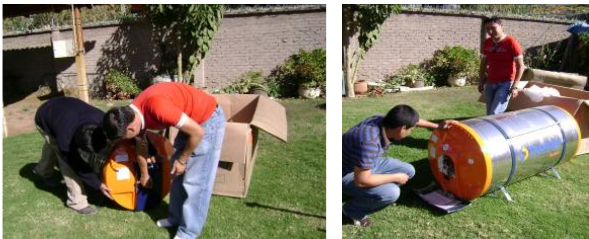
Foto 1. Verificando las especificaciones técnicas del equipo termo-solar y sus respectivos accesorios.

termo-solar en el albergue turístico comunitario. Después de las respectivas conversaciones con el presidente de ASALED, se dio la autorización de partida del equipo termo-solar y sus respectivos accesorios a la empresa SIE situada en la ciudad de Cochabamba. Días antes a la partida en los depósitos de la empresa SIE se verificaron los equipos y accesorios a ser instalados y el cumplimiento de las especificaciones técnicas solicitadas del material y equipo correspondientes al sistema termo-solar.