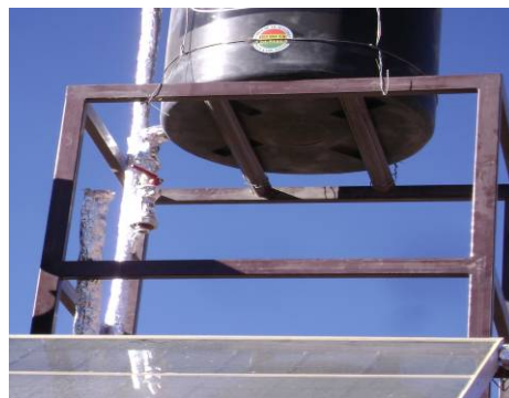
Foto 17. Deterioros modificados por los técnicos instaladores.