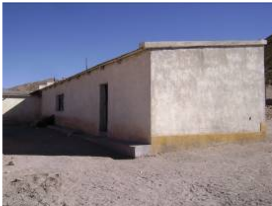
Foto 11. Ambiente adecuado para centro artesanal de esquilado e hilado de lana.