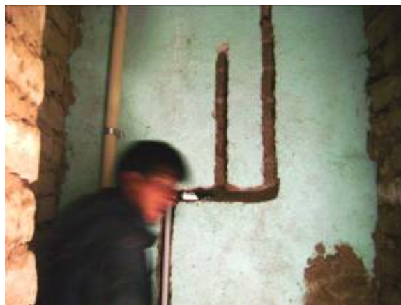
Foto 9. Realización de uniones, acoples y empalmes correspondientes al sistema termosolar.

Posteriormente a horas 19:30, se realizó una reunión entre los miembros del equipo consultor, las autoridades de San Antonio y los comunarios, con el objetivo de coordinar acciones relacionadas con los proyectos en ejecución.