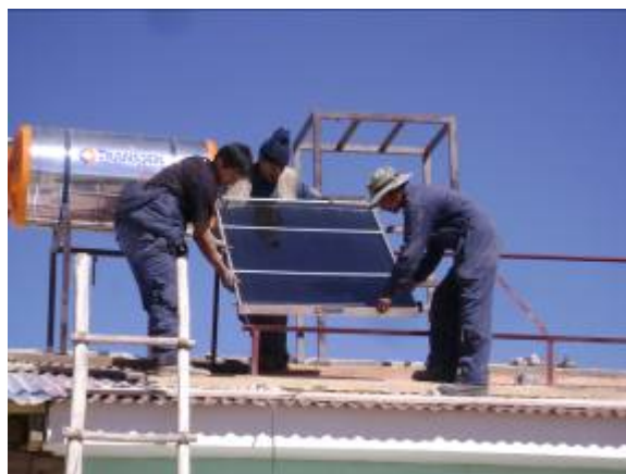
Foto 8. Montaje de las estructuras de soporte y de los paneles solares.

En horas de la tarde después de retornar de la pausa de medio día, se realizaron los acoples de las tuberías de agua fría y caliente con sus respectivos accesorios para las dos duchas destinadas en el albergue. Al culminar la tarde se logró tener un 90% de avance en la instalación, la cual se acordó culminar al día siguiente.