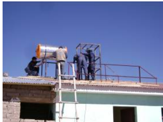
Foto 7. Comunarios colaborando en la instalación del sistema termo-solar.

A medio día se lograron asegurar las tres estructuras del termo-tanque, tanque de agua y de los colectores (paneles solares) respectivamente. También se lograron subir al techo los dos tanques para fijarlos en sus estructuras y concluir con el picado de las paredes para la instalación de las tuberías de agua.