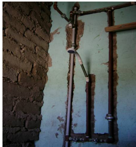
Foto 16. Instalación de la válvula termostática.

Igualmente se aprovechó el viaje para realizar la primera inspección del sistema termosolar instalado, en la cual se pudo constatar que las válvulas de apertura y cierre de los tanques de agua fría y caliente, además una de las uniones patentes estaban rotas debido al intenso frío que hizo en la comunidad y que el recubrimiento de protección no fue suficiente. También se observó que existían algunas fugas en las uniones de las llaves de paso en el sector de las duchas. Todas las fallas detectadas fueron subsanadas por los técnicos de SIE, quienes posteriormente realizaron pruebas de funcionamiento y estanqueidad del sistema y sus accesorios.