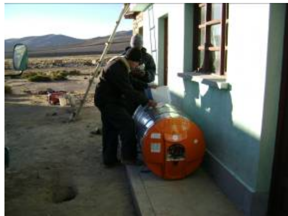
Foto 5. Entrega conforme del equipo termo-solar y sus accesorios al presidente de ASALED