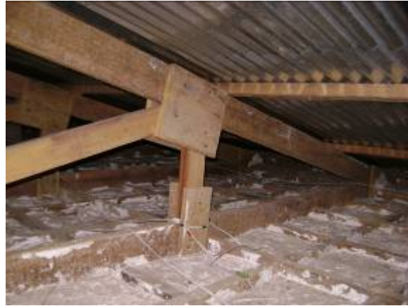
Foto 6. Verificación de puntos de apoyo de las estructuras del sistema termosolar.

Una vez ubicados los puntos de apoyo se prosiguió con la instalación del sistema termosolar. A las dos personas designadas por la comunidad para colaborar con la instalación se les indicaron las tareas a realizar que consistían en picar la pared del albergue para ubicar las cañerías de distribución de agua fría y caliente hacia las dos duchas y subir las estructuras metálicas para los tanques de agua fría y caliente en el techo del albergue.