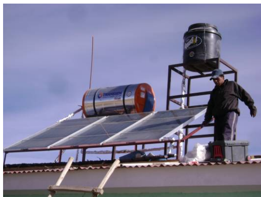
Foto 18. Sistema termosolar concluido.

Por último se aprecia que faltaba realizar el vaciado del piso del ambiente y el revoque de paredes respectivamente, comprometiéndose el encargado y los comunarios a realizar dichas obras cuando mejore el tiempo ya que las temperaturas en la comunidad todavía permanecían bajas (aproximadamente 5 grados centígrados bajo cero).