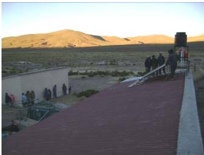
Foto 14. Realizando el taller de capacitación a la población.

Falta realizar el vaciado del piso del ambiente de las duchas y el revoque de paredes respectivamente. Estos trabajos son la contraparte de la comunidad.