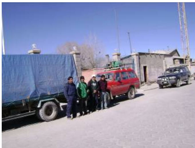
Foto 3. Partida de la localidad de Uyuni a la comunidad.

El personal de la empresa SIE realizó el abastecimiento de combustible al camión en la ciudad de Uyuni para el viaje de ida y vuelta. Se logró partir en la hora fijada anteriormente.