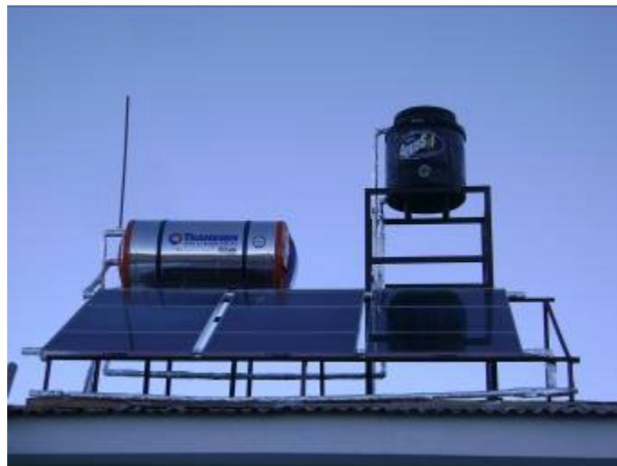
Foto 13. Sistema termo-solar instalado en el albergue turístico comunitario.

A medio día se logró concluir la instalación del sistema termo-solar en el albergue turístico comunitario.