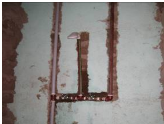
Foto 15. Paredes de las duchas sin revoque.

La instalación del sistema termo-solar se realizó sin la válvula termostática, quedando pendiente para una próxima visita a la comunidad, debido a que la empresa SIE, realizó la compra de la válvula de su proveedor que se encuentra en Chile y se tuvo demora en el envío. En un viaje posterior el técnico de SIE, instalará la válvula termostática y aprovechará para realizar la primera inspección del sistema termo-solar.