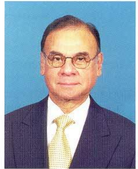
Dr. Alí Rodríguez-Araque, Secretary General of the Organization of the Petroleum Exporting Countries (OPEC)

At the meeting of March 16, two new observers, Kazakhstan and Equatorial Guinea, were added and attended an OPEC Conference for the first time. The increasing interest in OPEC on the part of independent producers is yet another demonstration of the Organization's growing influence and effectiveness.