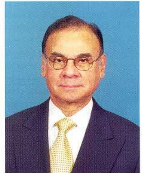
Doctor Alí Rodríguez Araque, Secretario General de la Organización de Países Exportadores de Petróleo (OPEP)

En cuanto a los productores no OPEP, Angola, México, Omán y la Federación Rusa han venido participando como observadores en las reuniones de la OPEP desde hace algún tiempo. A la vez, han tomado decisiones que apoyan los esfuerzos realizados por la Organización —ya sea aumentar o reducir producción— para estabilizar el mercado.