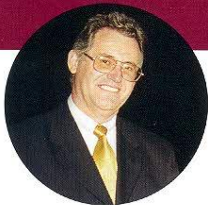
Ingeniero Carlos Herrera Descalzi, Ministro de Energía y Minas del Perú

N uestras naciones y sus pueblos estamos esforzándonos por encontrar formas de integración eficaz y para ello nos sustentamos en principios jurídicos, económicos y sociales que se empezaron a desarrollar alrededor de la mitad del siglo pasado. Inclusive, con el adelanto tecnológico y científico de los países más industrializados del mundo, estamos tratando de llevar nuestra civilización al cosmos.