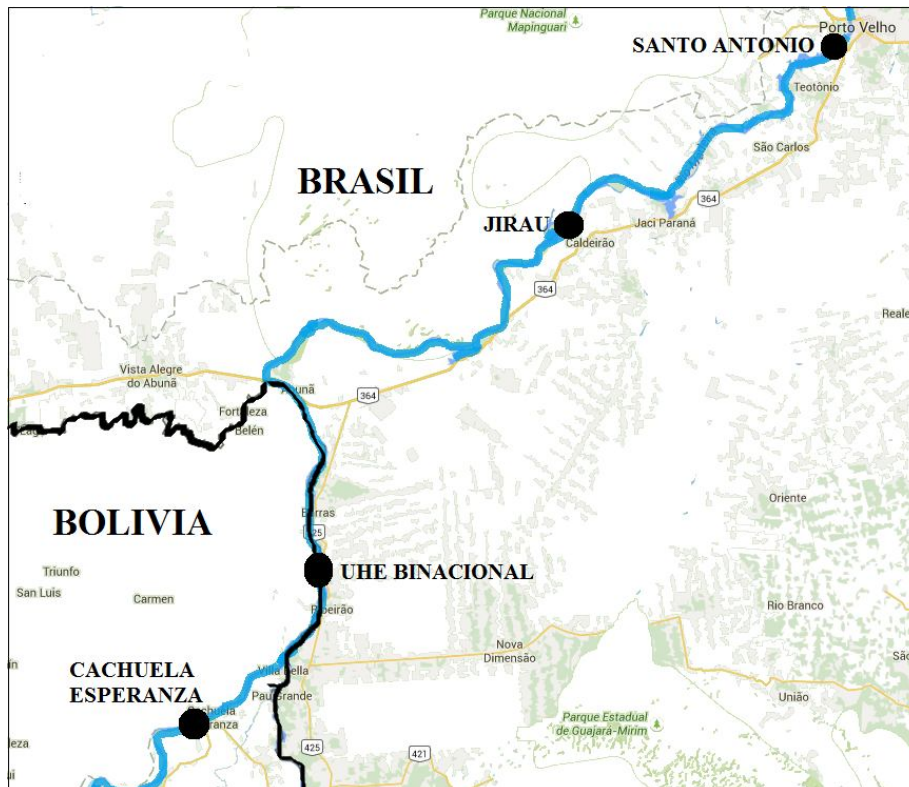
Figura 1 Usinas hidroeléctricas del "Complejo Hidroeléctrico del Rio Madera"

Velho 5 al Océano Atlántico resolviendo así un problema histórico y económico de acceso al mar para Bolivia.